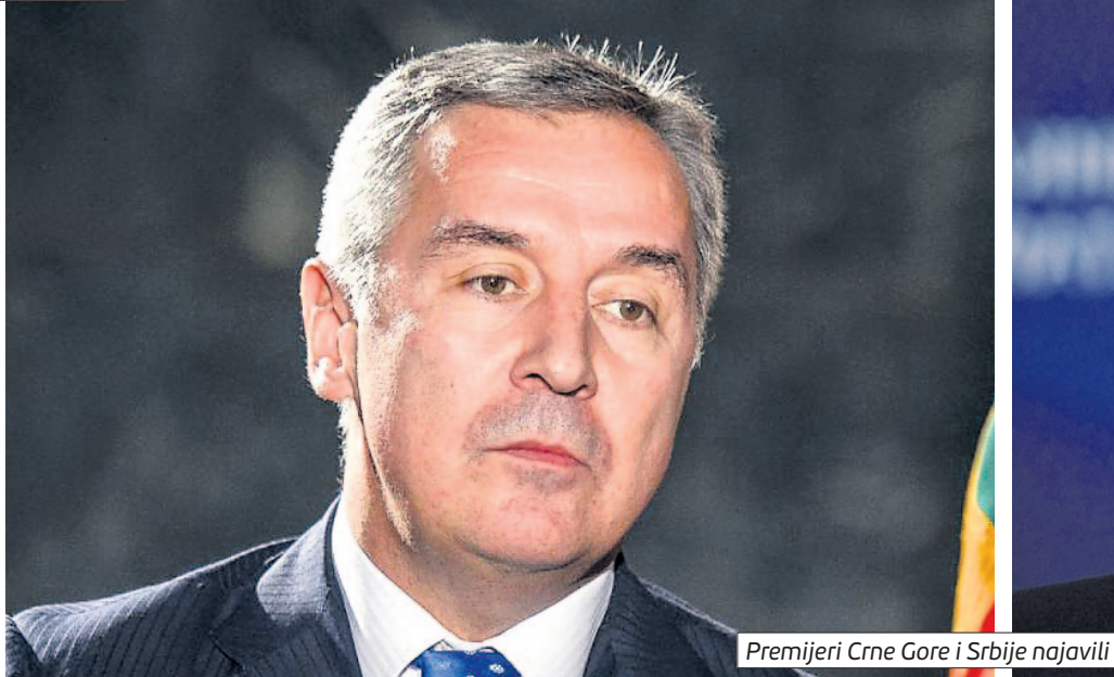
Premijeri Crne Gore i Srbije najavili