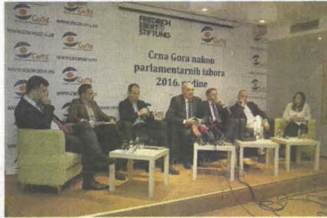
DPS ima većinu: Sa okruglog stola