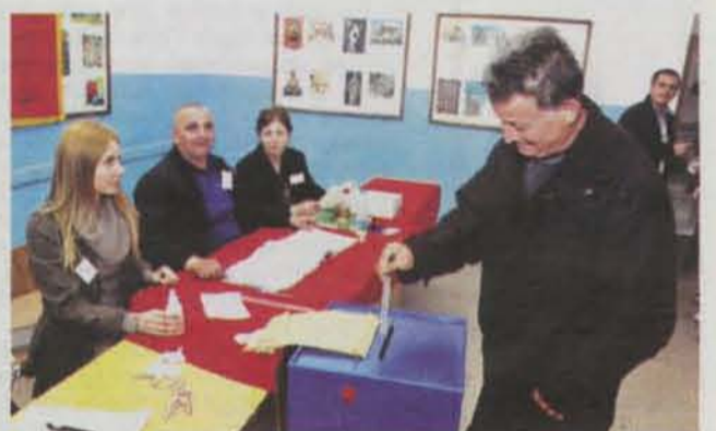
Детаљ са бирачког мјеста

Они су нагласили да је посебно интересантно да у току изборног процеса, само потписи подршке изборној листи, представљају једини услов за добијање средстава за финансирање изборне кампање, а у пракси су, како су истакли, постојали случајеви у којима су партије доби-