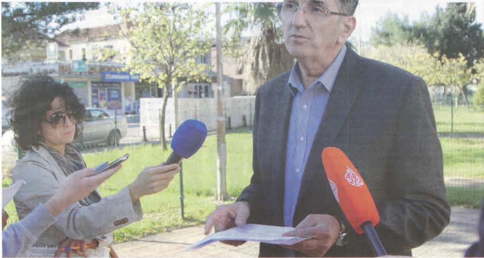
Javnost da prosudi da li je riječ o političkoj korupciji: Camaj