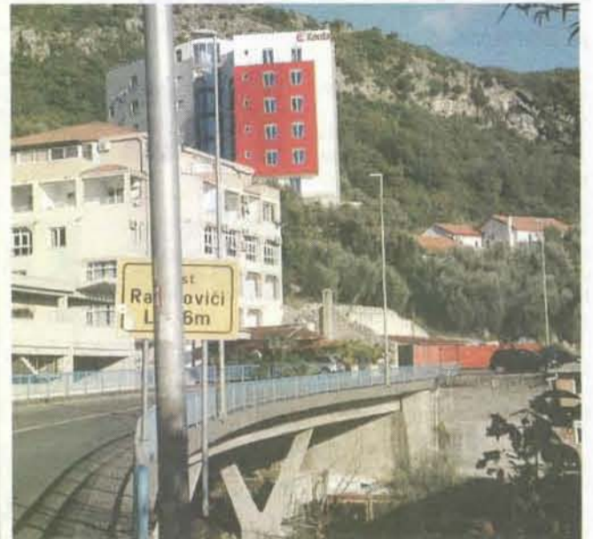
Apartmani "Gaga trenda" u Rafailovićima

U optužnom predlogu piše da je Crnovršanin od januara do marta 2015. godine, protivpravno iskorisćavanjem službenog položaja sebi pribavio korist, a školi nanio štetu u iznosu od 1.462 eura. K. R.