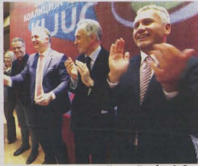
Челници „Кључа“ синој у Будви

Демократског савеза Албанаца, Српска странка, Бошњачко-демократска заједница и Странка српских радикала.