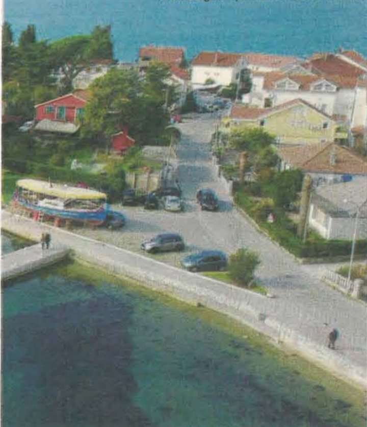
Aktuelni izgled kupališta