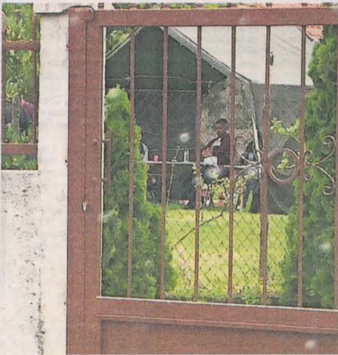
У непосредној близини бирачких мјеста 86А и 86Б у Голубовцима, у дворишту оближње приватне куће, активисти ДПС-а воде евиденцију изашлих бирача

Из ЦЕМИ су навели да је у Херцег Новом, у мјесту Топла, дијете уз присуство родитеља, а у њихово име, заокружило број на гласачком листићу и након тога убацило листић у гласачку кутију, а да је реакција бирачког одбора изостала.