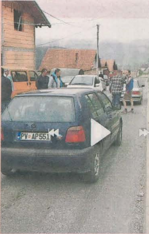
Инцидент у Пљевљима