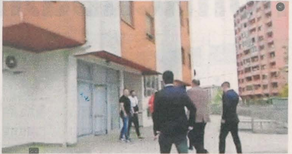
Подгорица, изборни штаб ДПС-а у Улици 4. јула

– Camere у објекту нијесу биле покривене, па би у случају гласања била повријеђена тајност гласања. Четири гласача су враћена, није им дозвољено да гласају. Гласање се одвија у нормалним околностима – саопштено је из ЦЕМИ.