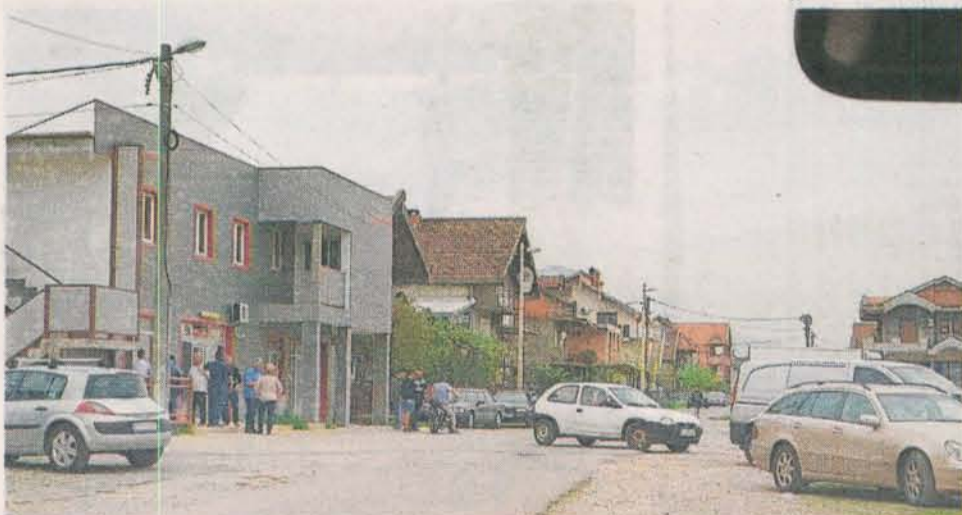
Неправилности- Стари аеродром-Подгорица, ОШ „Божидар Вуковић Подгоричанин“