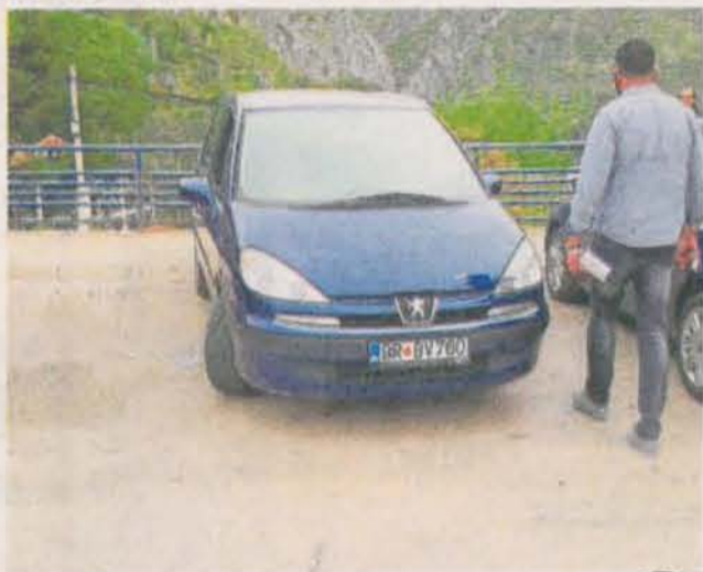
Наставак на следећој страни