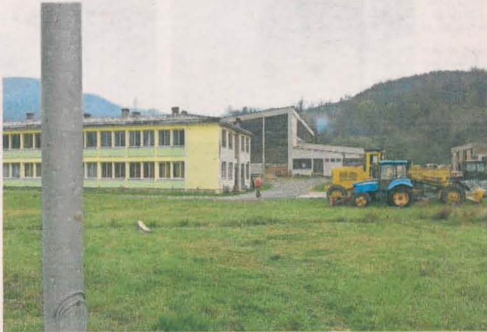
У Мојковцу камере на више биралишта

Један од чланова бирачког одбора на бирачком мјесту 97 у Никшићу – Дом Старо село тражио је и добио одговор од осталих чланова бирачког одбора о томе да ли су поједини бирачи искористили своје право гласа. Тиме је прекршен члан 71а Закона о избору одборника и посланика – указа-