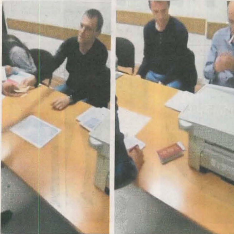
Опозиција снимала куповину гласова

■ Изборни дан у свим општинама обиљежила брутална кршења Закона о избору одборника и посланика. Евидентирани су очигледни примјери куповине гласова и притисака на бираче