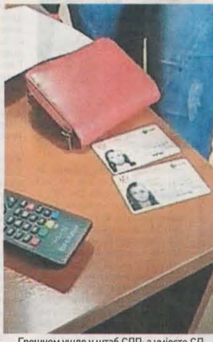
Грешком ушле у штаб СДП-а уместо СД

ЦЕМИ је утврдио да је дошло до прекида гласања у трајању од 30 минута на бирачком мјесту 105 – Дом омла-