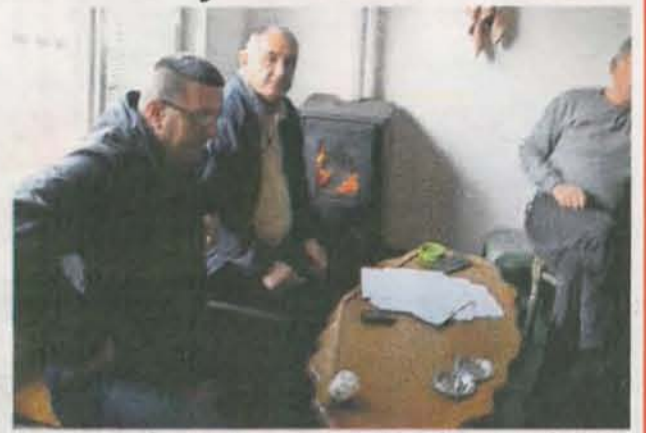
Сумња у куповину гласова у изборном штабу ДПС-а

– Поред овога, примјењено је више возила без регистарских ознака која су била на услузи ДПС-у. Незаконита радња, строго прекршано дјело возња возила без регистарских ознака, која се по закону морају искључити из саобраћаја, а идентитет лица које их вози и власника одмах утврдити, учестала је појава у изборном дану у Беранама.