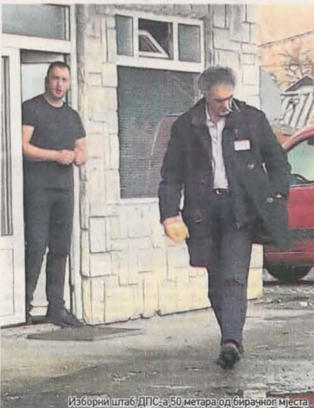
Изборни штаб ДПС-а 50 метара од бирачког мјеста